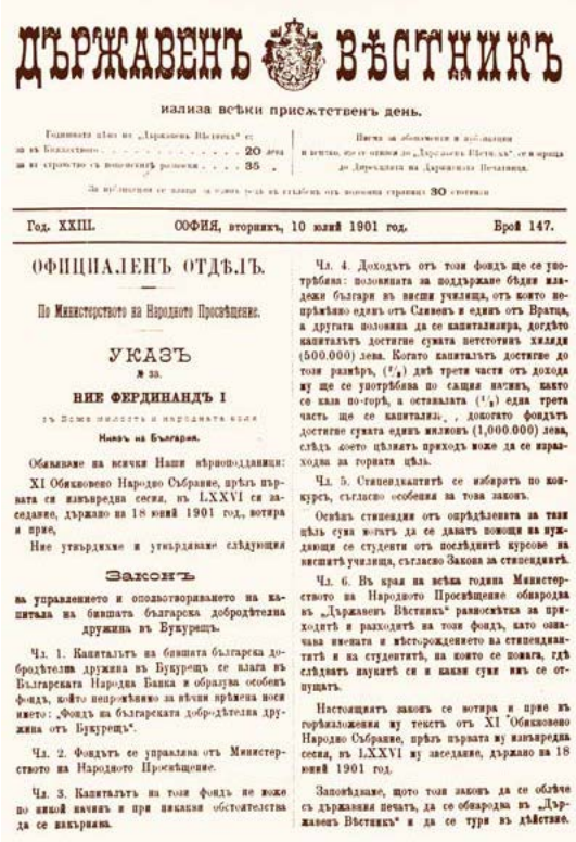
Закон за управление и оползотворяване на капитала на бившата Българска добродетелна дружина в Букурещ, 1901 г. Регламентира учредяването на Благотворителен фонд, от който до 1948 г. се дават стипендии за следване в чужбина и средства за специализации.