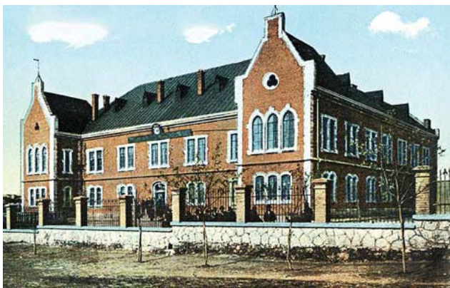
Мъжката гимназия във Варна, която към 1940 г. разполага с 15 благотворителни фонда с общ капитал от около 1 млн. лв. Средствата са предназначени за предоставяне на стипендии и награди за подпомагане на бедни ученици.